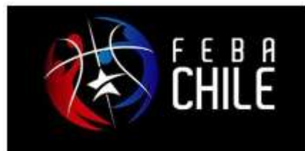
TABLA EDADES 2019